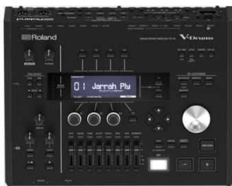
Figuur 1: Roland TD-50

De drummodule heeft ook Drum Master Balanced XLR Out (L + R) , echter dan heeft de geluidsman géén mogelijkheid om signalen apart te sturen.