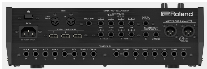
Figuur 2: Roland TD-50 (rear view)